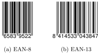
Figura 1: Códigos de barras EAN

La manera concreta de codificar mediante barras los números y las letras puede ser muy variada, lo que ha llevado a la aparición de diferentes estándares. De todos ellos, el EAN ( European Article Number ) resulta ser el más extendido. De éste, hay principalmente dos formatos, que se diferencian en el ancho. Existe así el llamado EAN-8, que codifica 8 números, y el EAN-13, que, naturalmente, codifica 13.